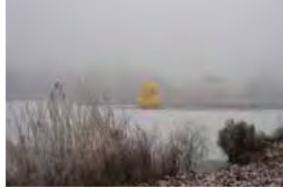
Amsterdam (NL) 5m