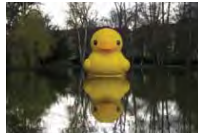
Nürnberg (DE) 5m