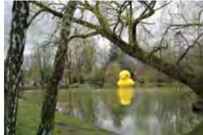
Nürnberg (DE) 5m