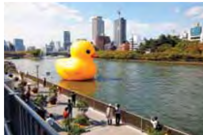
Osaka (JP) 10m