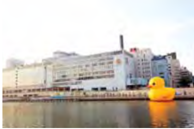
Osaka (JP) 10m