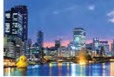
Osaka (JP) 10m