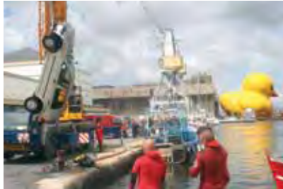
Saint-Nazaire (F) 26m