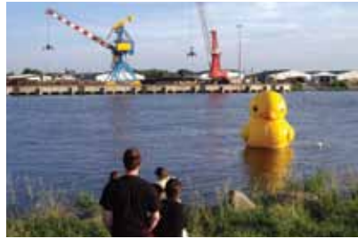
Nantes (F) 5m