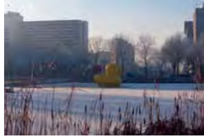
Amsterdam (NL) 5m