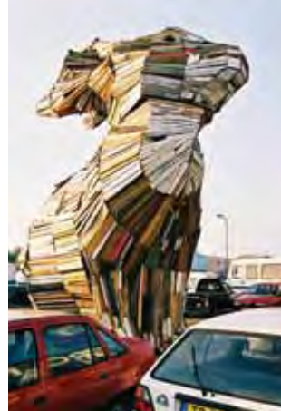
De Reus van Vlaardingen 2002 - 2003 Vlaardingen (NL) 8m x 10,5m x 5,5m