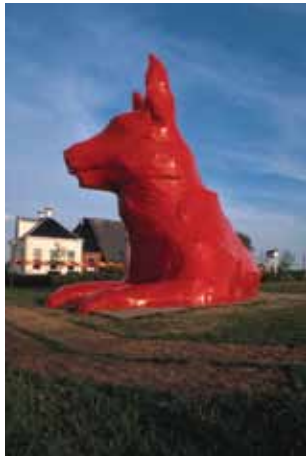
Max 2003 Leens (NL) 12m x 8m x 25m