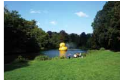
Wassenaar (NL) 5m