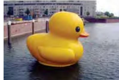
Rotterdam (NL) 5m