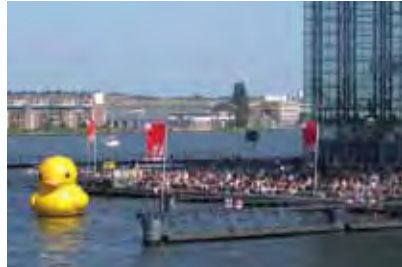
Amsterdam (NL) 5m