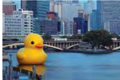
Osaka (JP) 10m