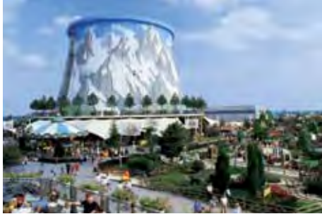
Koeltoren 1998 - 1999 Kalkar (DE) 50m x 300m