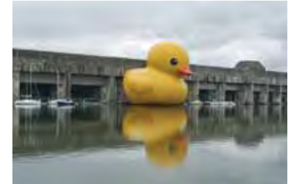
Saint-Nazaire (F) 26m