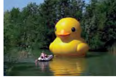
Elst (NL) 5m