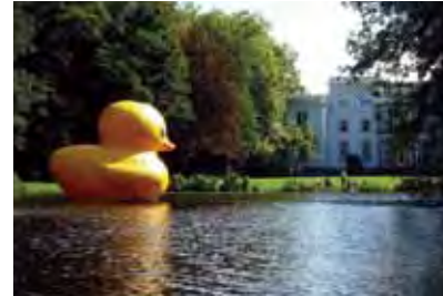
Wassenaar (NL) 5m