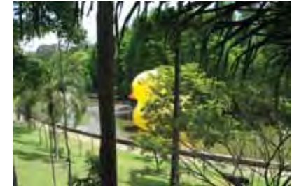
Sao Paulo (BR) 12m