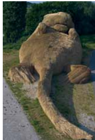
Muskusrat 2004 Nieuwerkerk aan den IJssel (NL) 32mx 8m x 12m

Ook uit het project 'Gele straat' (2003) blijkt zijn sterke engagement. 'Hoewel Schiedam de armste gemeente van Nederland is, bestonden er plannen om een nieuwe verkeersader door het centrum te trekken. Met mijn meer dan een kilometer lange gele straat heb ik dat gevisualiseerd. Het vormde mijn bijdrage aan hun 'weg naar gelukzaligheid'.'