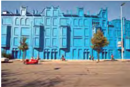
Beukelsblauw 2004 - 2006 Rotterdam (NL) 115m x 15m