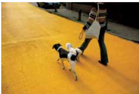
Yellow Street 2003 Schiedam (NL) 950m x 4,5m

His strong commitment is also reflected in projects such as 'Gele straat' (Yellow Street 2003). 'Even though Schiedam is the poorest municipality in the Netherlands, there were plans to build a new arterial road straight through its centre. This I visualised with my more than one-kilometre-long yellow street. It was my contribution to their 'road to happiness'.